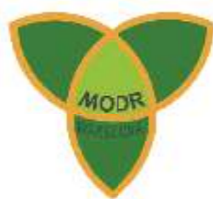
Mazowiecki Ośrodek Doradztwa Rolniczego