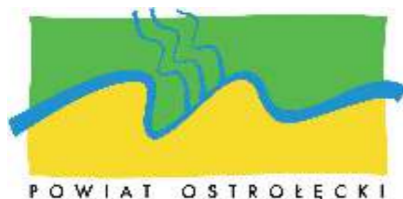
POWIAT OSTROŁECKI Starostwo Powiatowe w Ostrołęce