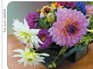
Kwiaty posadzone w rynnach. W ten sposób mieszkańcy Chudoby, znani z zamilowania do dekarstwa, upiększają dachy swoich domów

Od 12 do 14 września grupa sołtysów z Mazowsza uczestniczyła w wycieczce studyjnej „Z funduszem sołeckim ku odno-