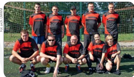
Reprezentacja Mazowsza na II Spartakiadzie KSOW

30 września zapraszamy na VII Jesienny Jarmark „Od pola do stołu” do Mazowieckiego Ośrodka Doradztwa Rolniczego Oddział Poświętne w Płońsku. Jarmark tradycyjnie poświęcony jest promocji dziedzictwa kulturowego mazowieckiej wsi, różnych form przedsiębiorczości wiejskiej oraz twórczości ludowej. To również świetna okazja do zaprezentowania oferty wypoczynku na wsi, a także żywności tradycyjnej oraz produkowanej w gospodarstwach ekologicznych. Będą promowały się również gminy powiatu płońskiego na stoisku Lokalnej Grupy Działania – Przyjazne Mazowsze. Jak zwykle wystawie towarzyszyć będą kiermasze drzewek owocowych, krzewów i kwiatów.