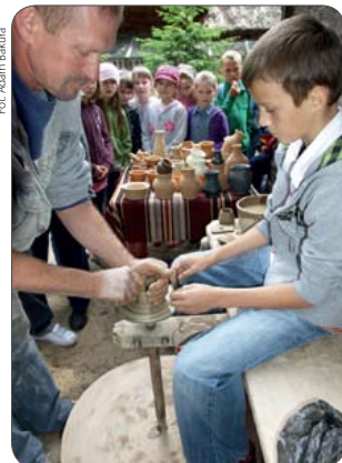
Lepienie garnków wcale nie jest takie łatwe, jak się na początku wydawało

Przedsięwzięcie zorganizowało Stowarzyszenie Artystów Kurpiowskich we współpracy z gminami kurpiowskimi, Muzeum Kultury Kurpiowskiej, Centrum Kultury Kurpiowskiej i oczywiście Krajową Siecią Obszarów Wiejskich.