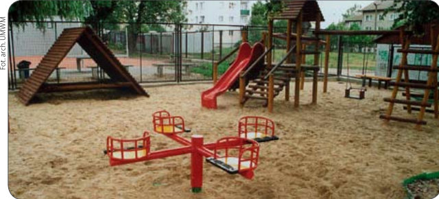
Realizując swój projekt, gmina Kaluszyń (powiat miński) udowodniła, że wieś może być przyjazna dla każdego mieszkańca