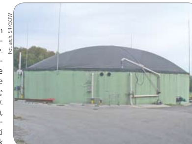
Wizyta w biogazowni w Ramingstein pozwoliła podpatrzeć, jak efektywnie można wykorzystywać odnawialne źródła energii. Na zdjęciu jeden z obiektów technicznych

Razem z grupą ponad trzydziestu rolników z całego Mazowsza odwiedziliśmy kilka funkcjonujących biogazowni i biocięplowni. Dyskutowaliśmy o źródłach energii odnawialnej, możliwościach ich wykorzystania w Polsce, podglądaliśmy rozwiązania techniczne i organizacyjne.