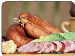
Kielbasa staropolska szydłowiecka znajduje się już na liście produktów tradycyjnych

Targi gromadzą wielu wystawców z bardzo różnorodną ofertą – od atrakcji kulturalnych po kulinarne. Jest tu zatem i coś dla ciała, i coś dla ducha. Stanowiska targowe tętnią życiem – można usłyszeć gwary i tradycyjne śpiewy, a także obejrzeć lokalne, kolorowe stroje. Sporo jest seminariów i wykładów. Mazowsze i moja lokalna grupa działania stawia także na różnorodność oferty, będziemy zatem pokazywać zarówno piękno mazowieckiej przyrody, jak i atrakcyjność za-