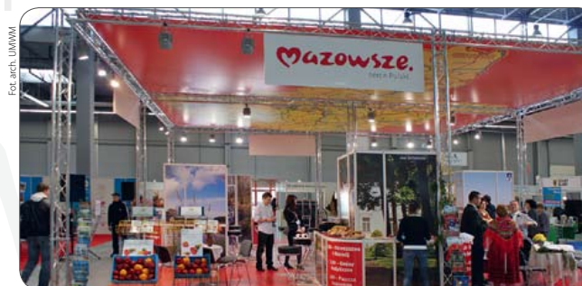
Ekspozycja na targach Agrotavel w Kielcach

LGD mające siedzibę na terenie województwa mazowieckiego łącznie dysponują budżetem wynoszącym nieco ponad 290 mln zł. W ramach wszystkich działań Osi Leader zawarto 964 umowy przyznania pomocy na kwotę ok. 122 mln zł. Do chwili obecnej beneficjentom wypłacono prawie 40 mln zł. Możliwość ogłaszania przez lokalne grupy działania naborów wniosków do połowy