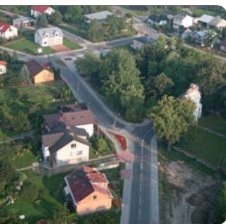
W gminie Borowie przybyło 14 nowych ulic