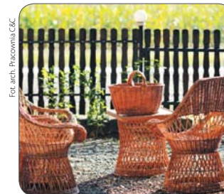
Nawet kilkugodzinny wypoczynek na wsi jest korzystny dla naszego zdrowia i samopoczucia

Agroturystyka to forma wypoczynku w warunkach wiejskich. Obejmuje różnego rodzaju usługi, począwszy od zakwaterowania, poprzez częściowe lub całonocne posiłki, wędkarstwo i jazdę konną, po uczestnictwo w pracach gospodarskich. Polega na wykorzystaniu piękna krajobrazu wiejskiego i uatrakcyjnianiu gościom pobytu możliwością uczestnictwa w codziennym życiu w gospodarstwie, a także poznania tradycji polskiej wsi – rzemiosła artystycznego (np. haftowania czy szydełkowania), obrzędów ludowych oraz przygotowywania potraw regionalnych, połączonych z wypiekiem chleba, wyrobem serów lub wędlin.